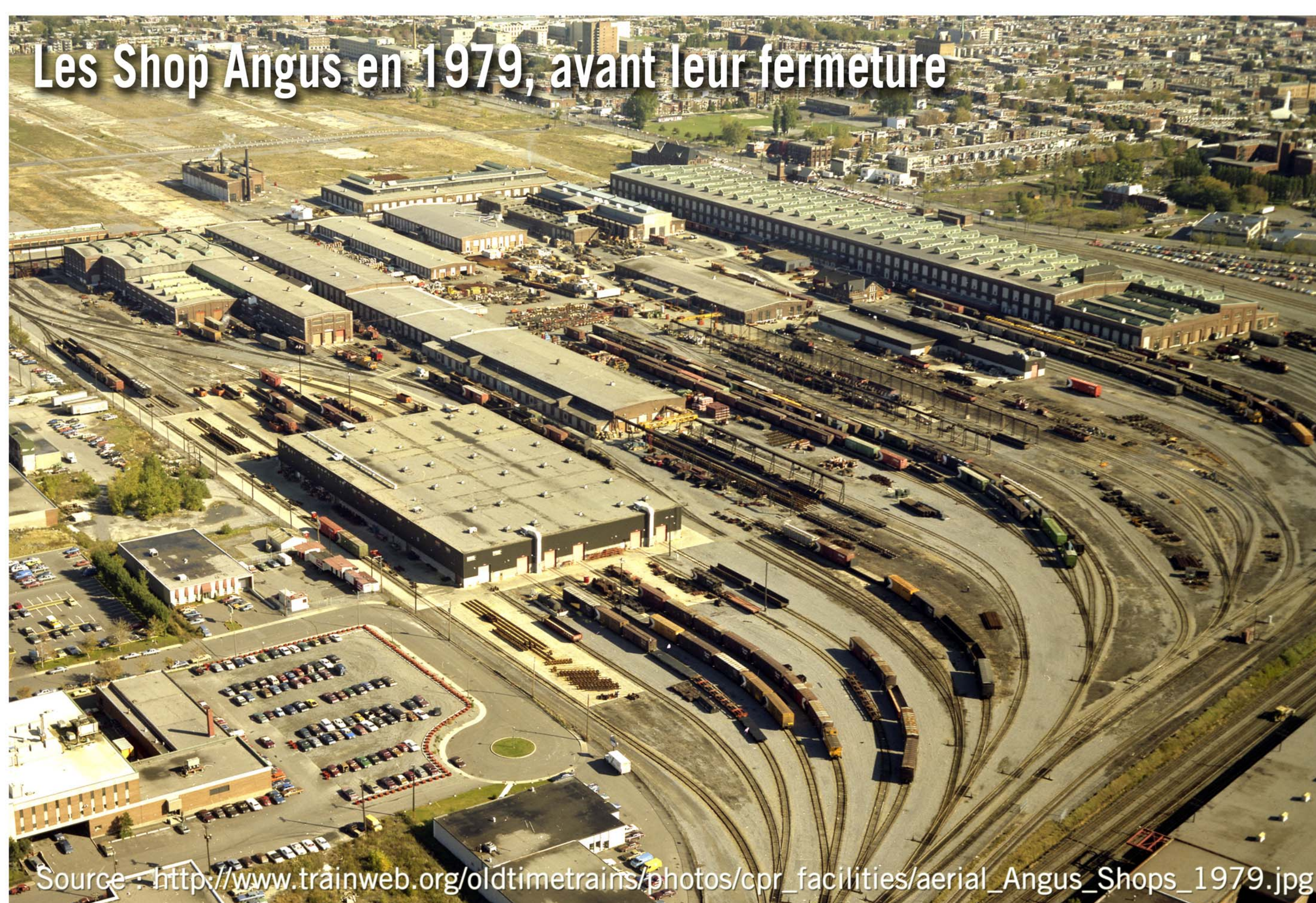
Les Shop Angus en 1979, avant leur fermeture